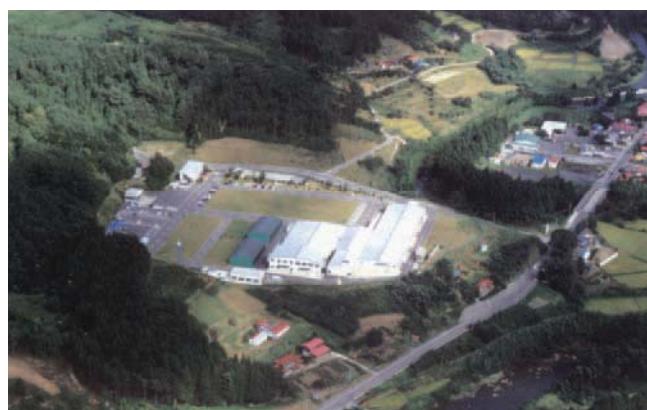
福島県石川町(猫啼温泉のそば)