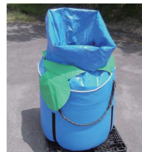
*つりロープ色は白または黒