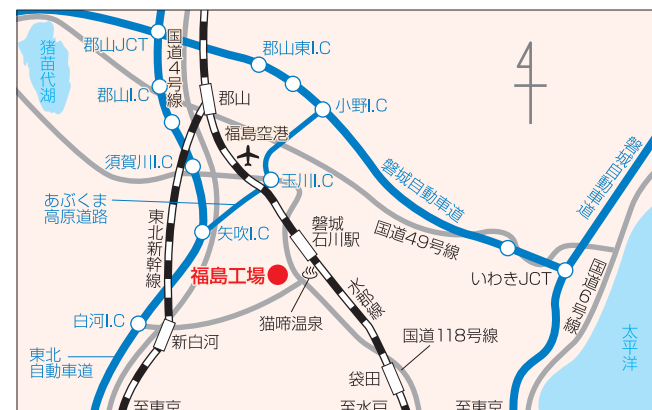
◎新幹線利用の場合：東北新幹線「新白河駅」下車⇒(車で)東に約30分 ◎車利用の場合：東北自動車道「白河I.C」より⇒東へ約40分